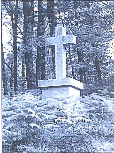
Croix de Capello